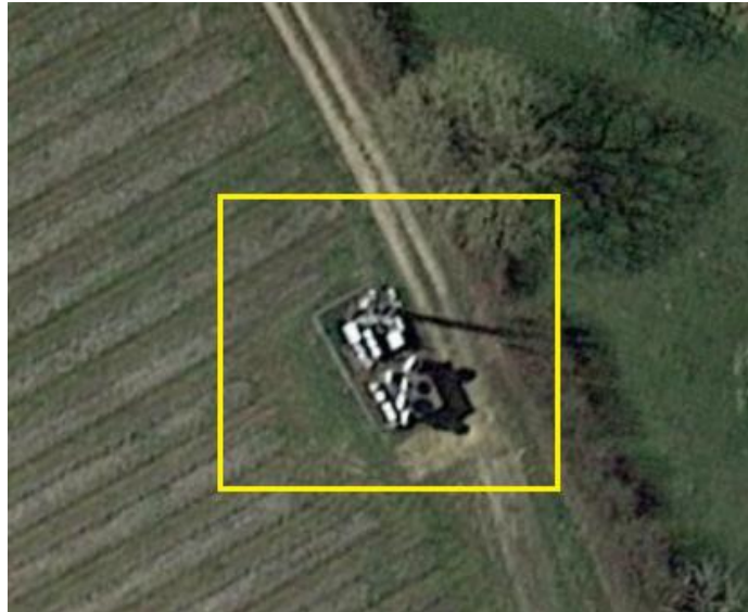
Figure 1: Vue des alentours des antennes