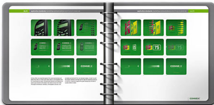
[9] Coerenta stilistica nu a fost lasata la voia intimplarii nici pe tv, unde s-au redeseinat cartoanele si pack-shot-urile.