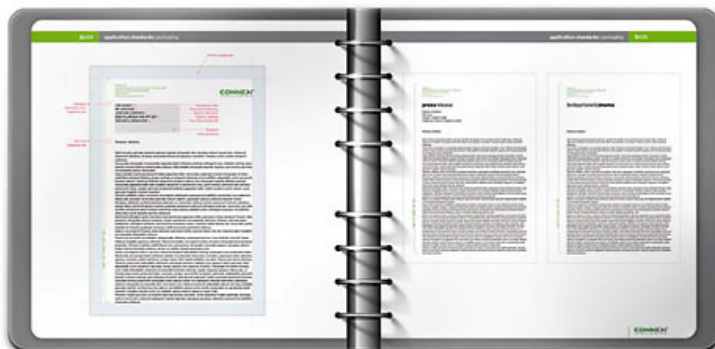
[2] A fost refacuta toata papetaria (stationery) pe criterii simple si functionale.