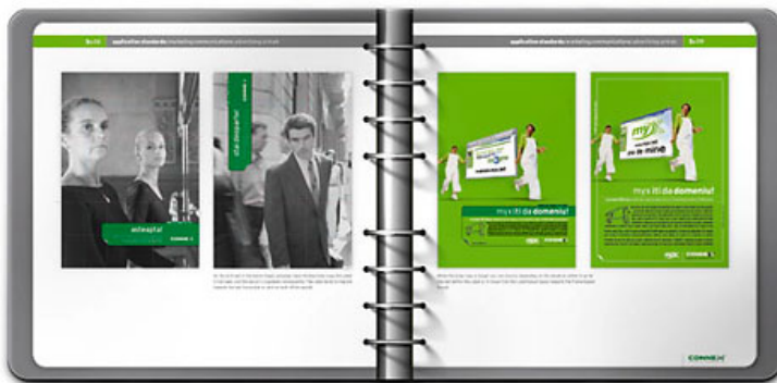
[6] Fotografia alb-negru a intrat in comunicarea de brand. In paleta cromatica au aparut 376 si Cool Gray 8 care strategic ajuta inglobarea lui Xnet si myX.