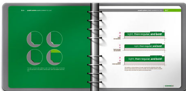
[4, 5] La indemna art directorului si a designerului a fost pus un limbaj grafic flexibil bazat pe o familie de forme cu care consistenta stilistica este usor de tinut.