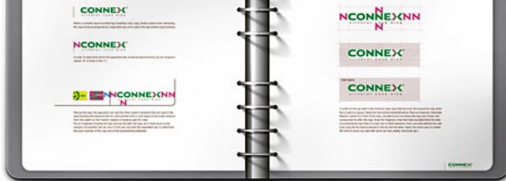
1. Pagini care descriu constructia 'zonei safe' in jurul logo-ului.