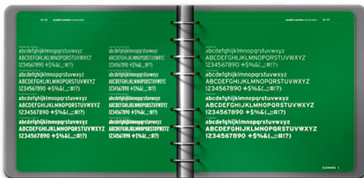
[3] Fontul corporate s-a schimbat de la Gill Sans la Interstate, un sans serif modern care se impaca bine cu noul spirit al comunicarii Connex.